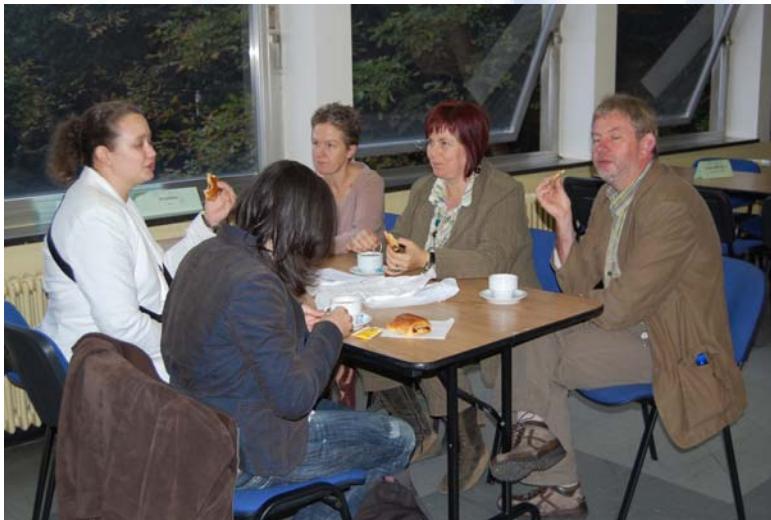
Enkele vroege vogels...