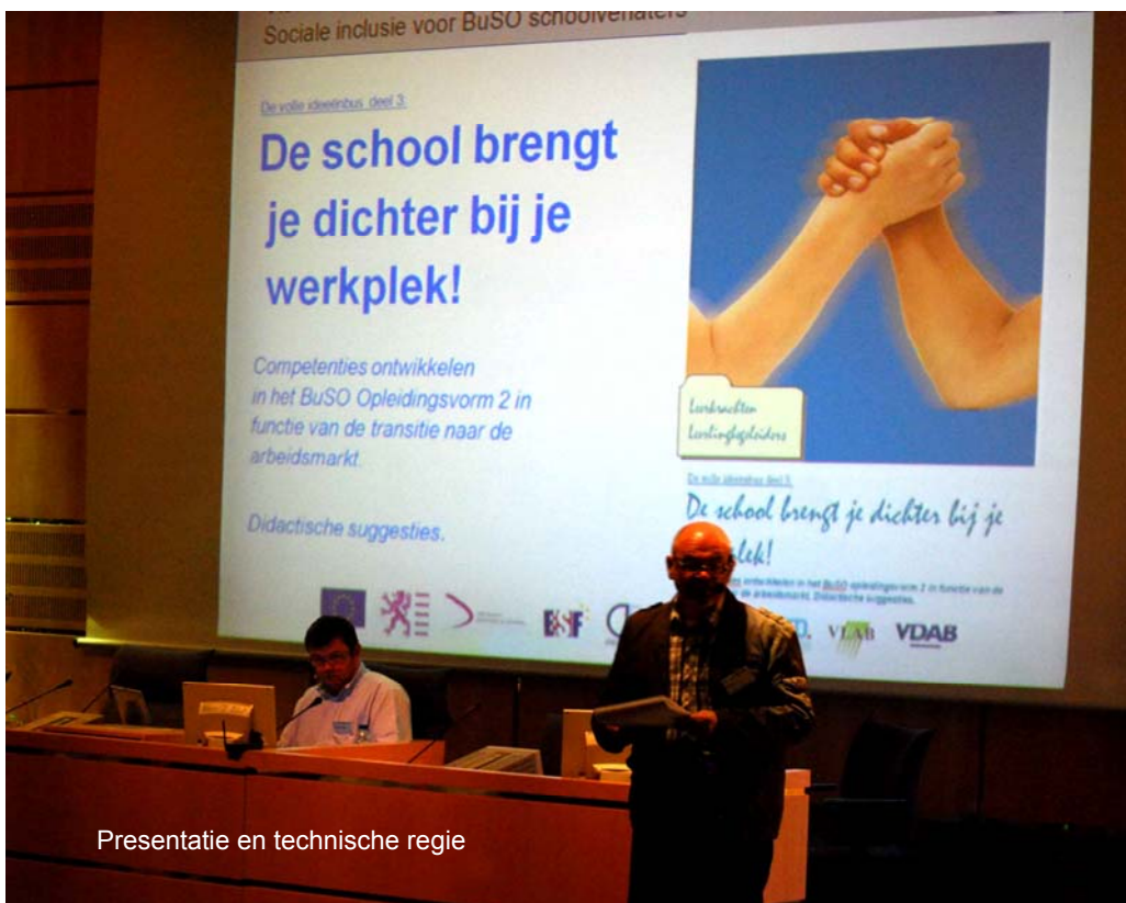
Presentatie en technische regie