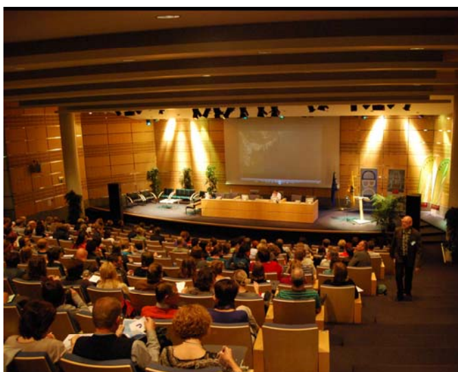
Ze kwamen van heinde en verre met de trein of ander openbaar vervoer.